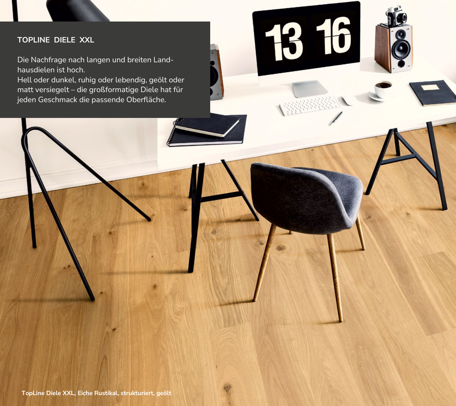
TopLine Diele XXL, Eiche Rustikal, strukturiert, geölt

Die Nachfrage nach langen und breiten Landhausdielen ist hoch. Hell oder dunkel, ruhig oder lebendig, geölt oder matt versiegelt – die großformatige Diele hat für jeden Geschmack die passende Oberfläche.