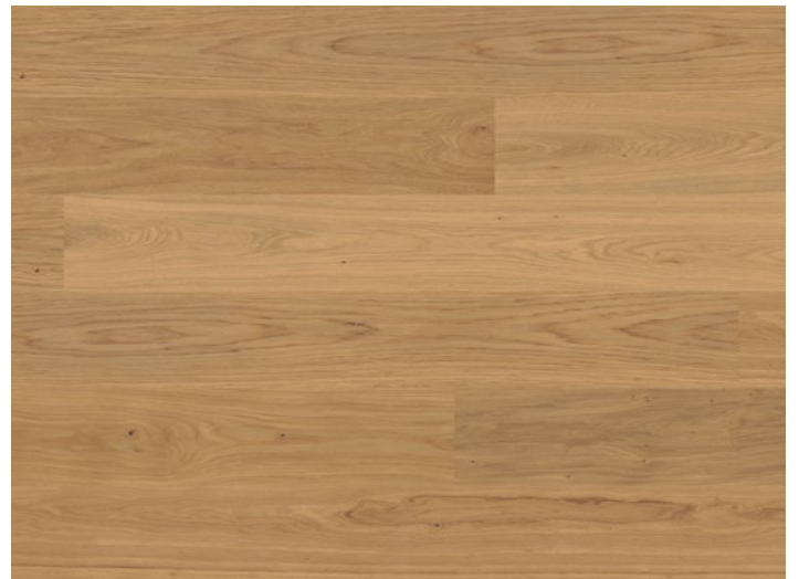
Eiche Classic ◆ strukturiert, geölt ◆ strukturiert, matt versiegelt