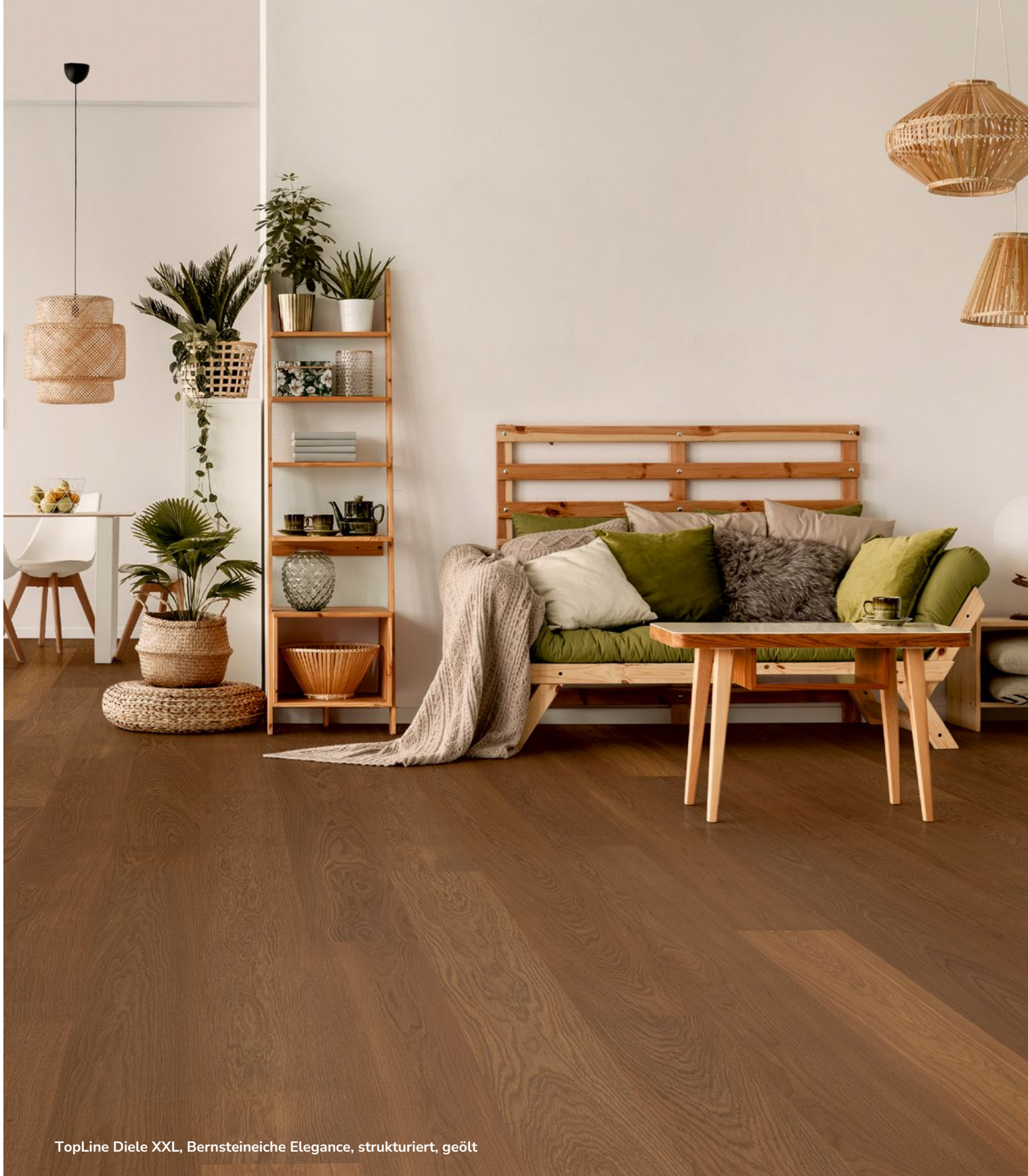
TopLine Diele XXL, Bernsteineiche Elegance, strukturiert, geölt