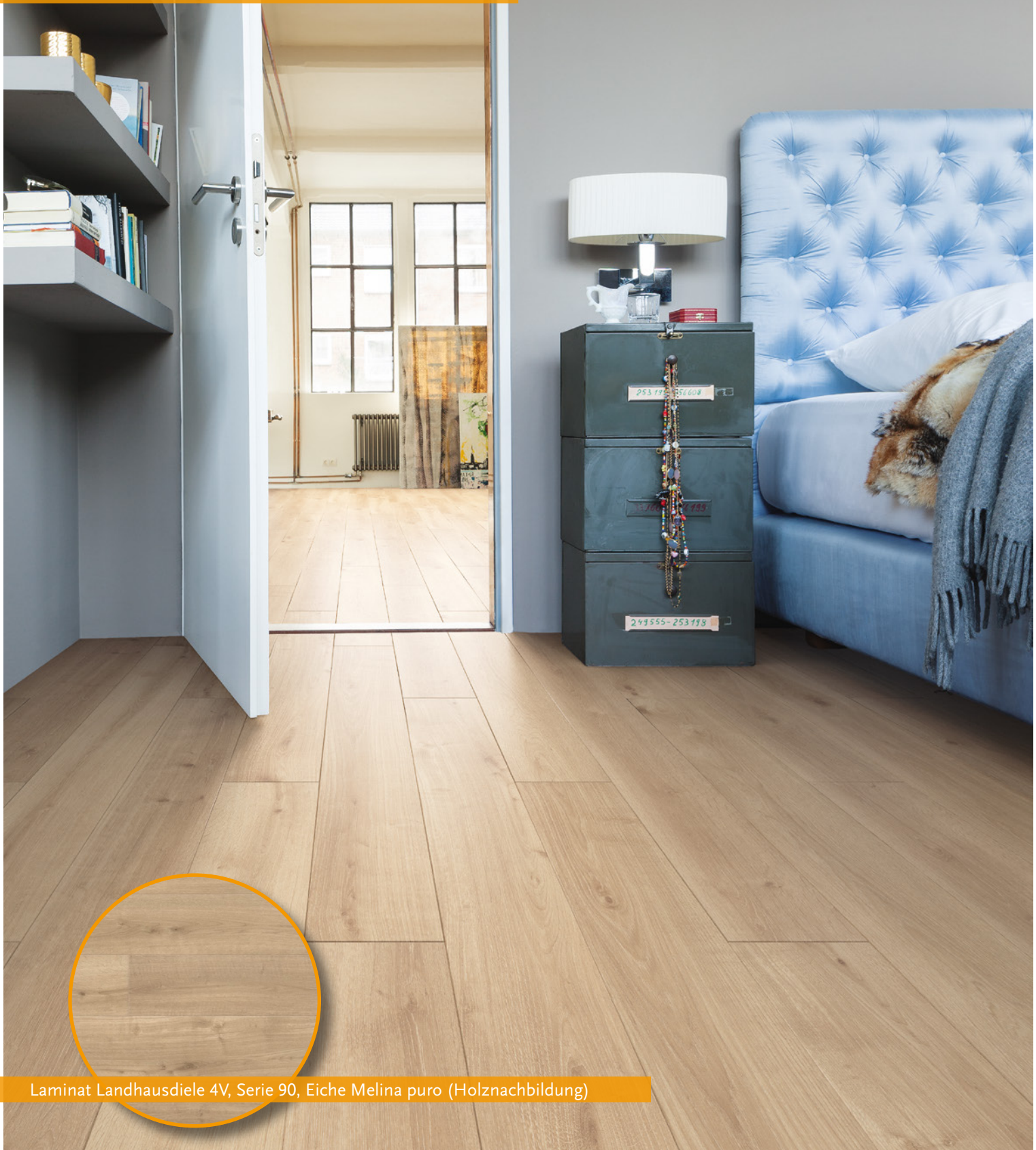
Laminat Landhausdielen 4V, Serie 90, Eiche Melina puro (Holznachbildung)

Zudem sind alle Laminatböden problemlos auf Fußbodenheizungen einsetzbar.