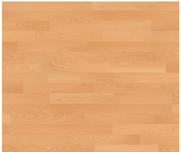
3-Tab, Serie 70, Buche beige