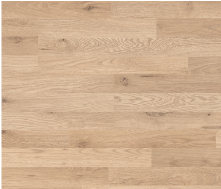
3-Stab, Serie 90, Steineiche