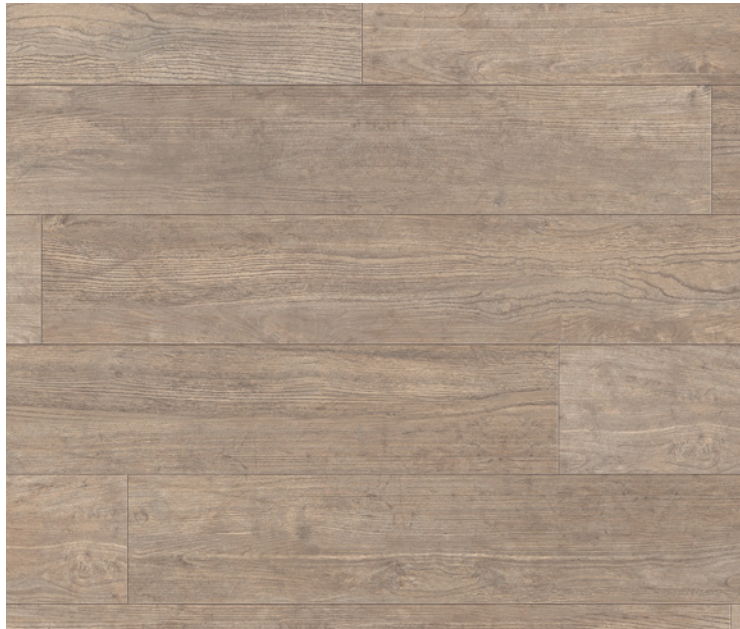
Landhausdiele 4V, Serie 100, Kastanie Impresso