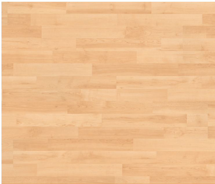
3-Tab, Serie 70, Ahorn Akzent