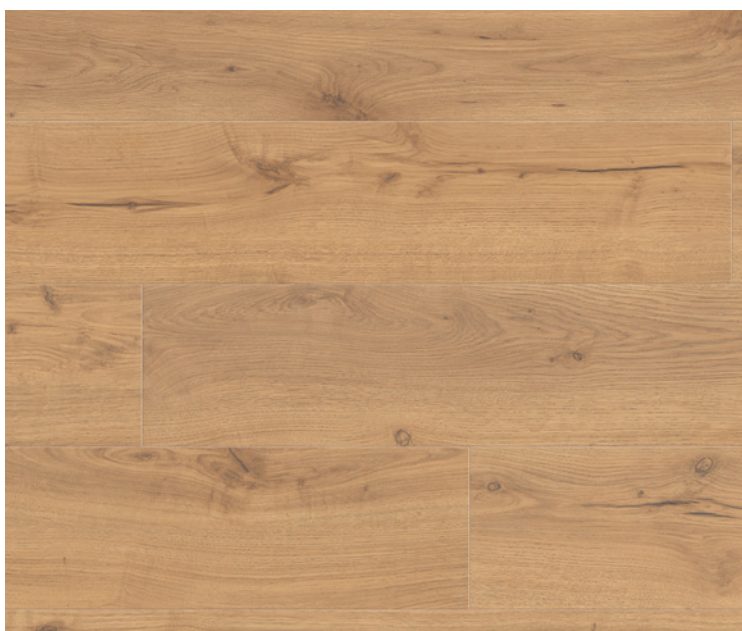
Gran Via 4V, Serie 100, Alpeineiche Natur