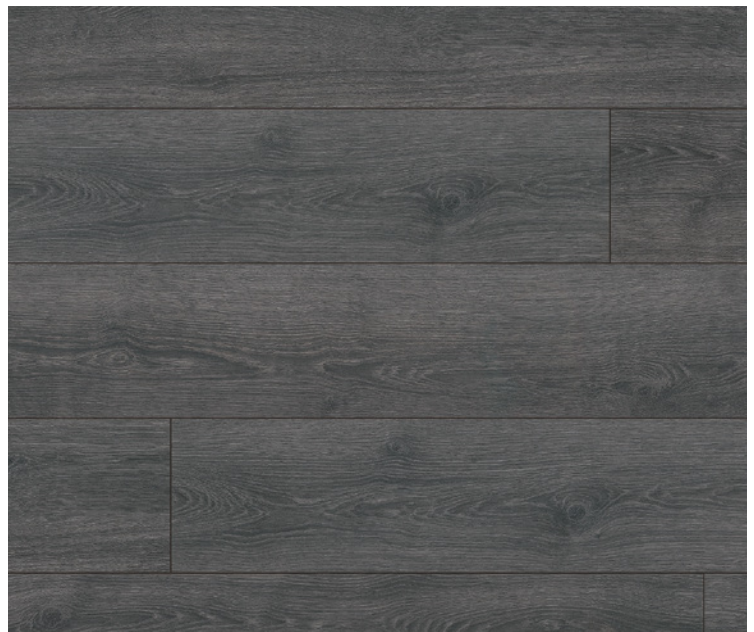
Gran Via 4V, Serie 100, Eiche Contura schwarz