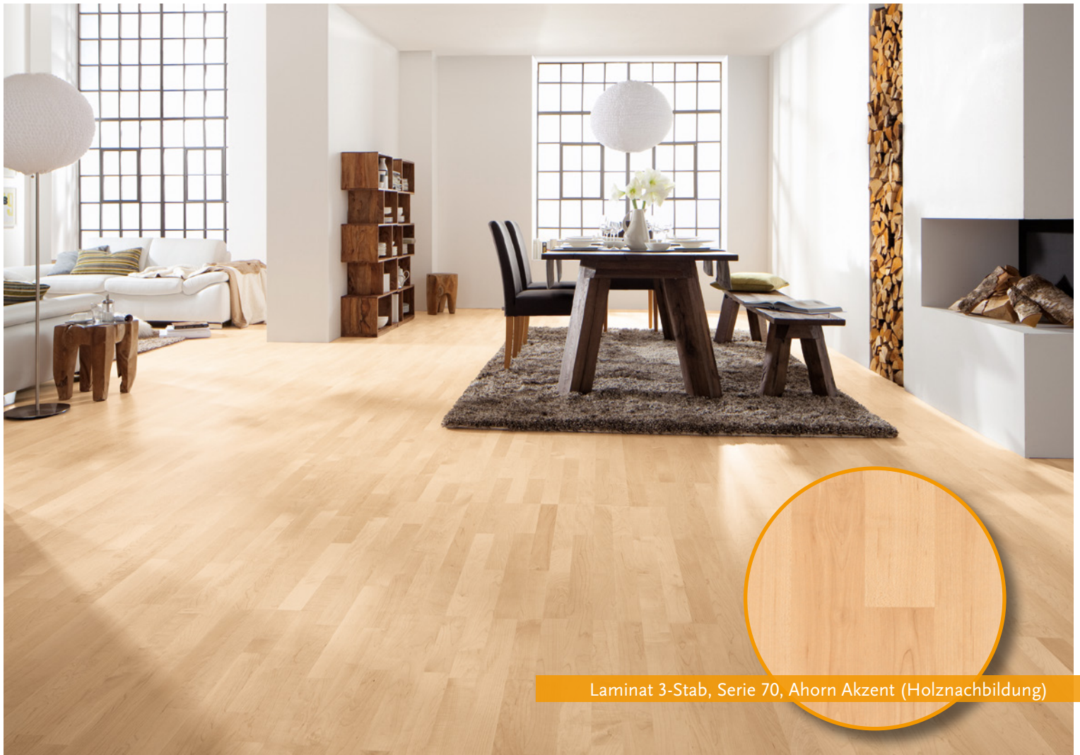
Laminat 3-Stab, Serie 70, Ahorn Akzent (Holznachbildung)