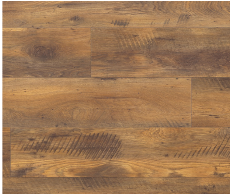
Gran Via 4V, Serie 100, Eiche Altholz