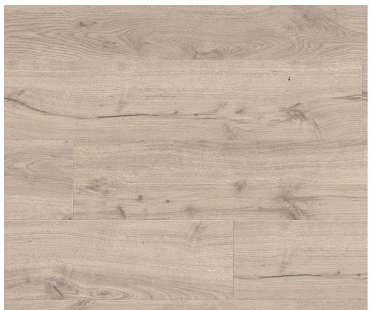
Gran Via 4V, Serie 100, Alpeineiche grau