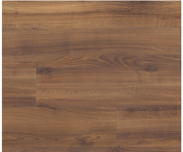
Gran Via 4V, Serie 100, Ital. Nussbaum