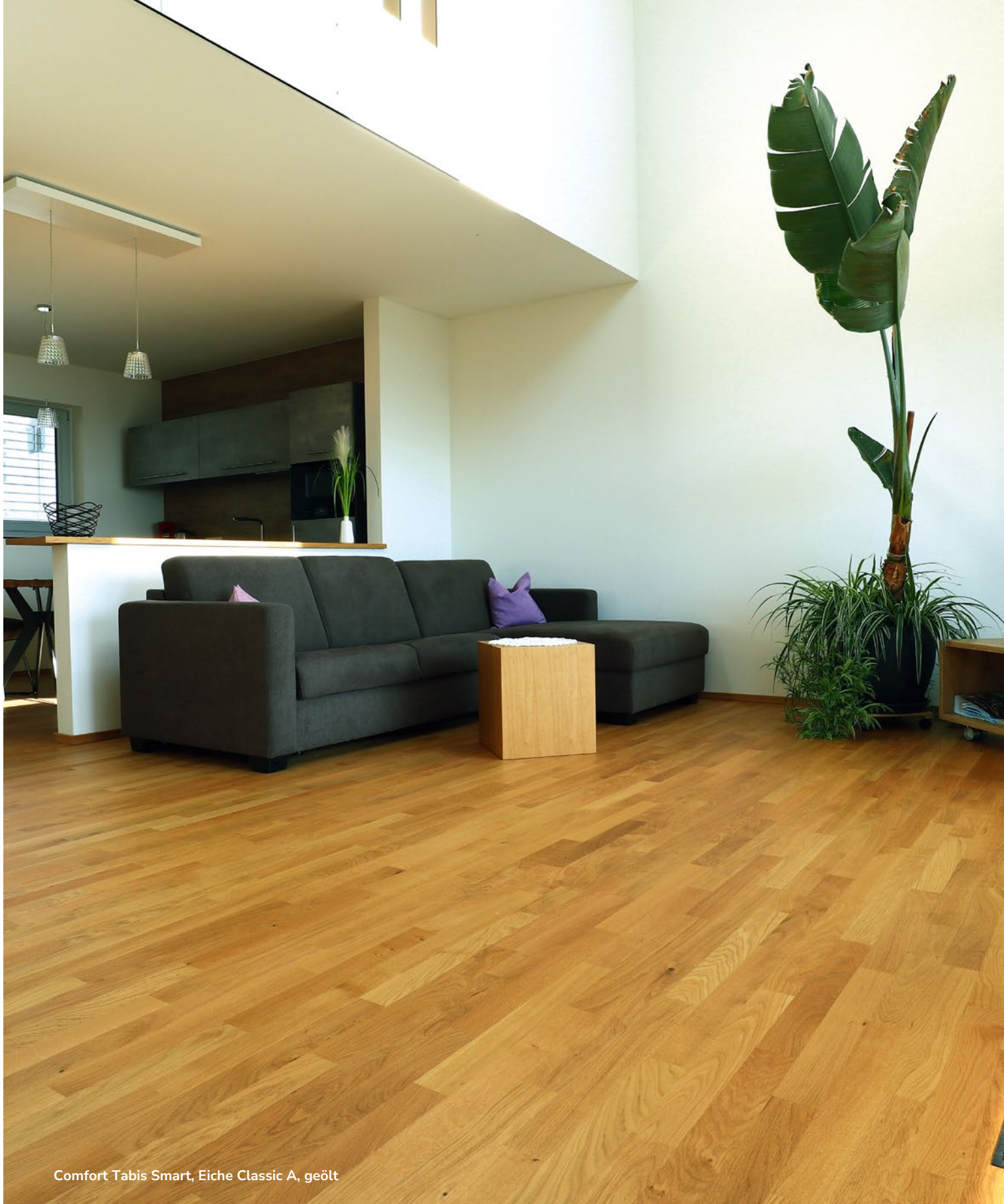
Comfort Tabis Smart, Eiche Classic A, geölt